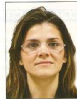
Foto con occhiali corretta