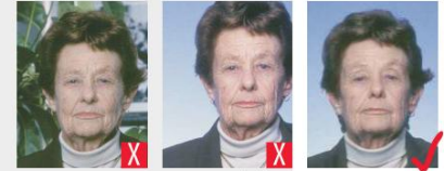
sfondo non a tinta unita non centrata