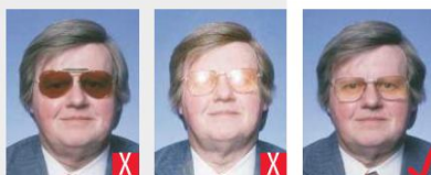
lenti scure riflesso del flash sulle lenti