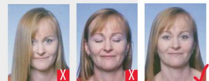
capelli sugli occhi occhi chiusi