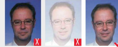
troppo scura troppo chiara