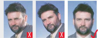
stile ritratto occhi inclinati