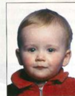
Foto bambino corretta