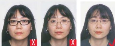
montatura troppo pesante montatura che copre gli occhi