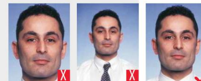
troppo vicino troppo lontano