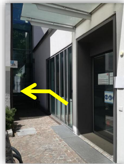
I Servizi Demografici del Comune di Campo Tures