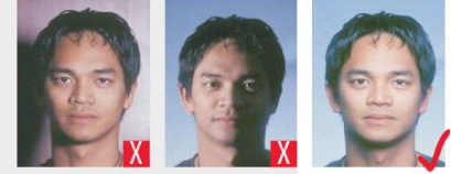
ombra dietro la testa ombre sul viso