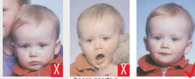
presenza di altra persona bocca aperta e giocattolo troppo vicino al viso