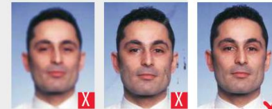
sfocato macchie d'inchiostro/pieghe