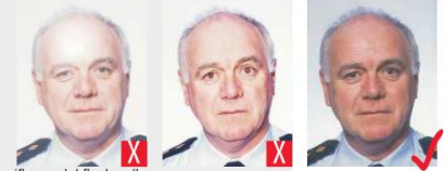
riflesso del flash sulla pelle effetto occhi rossi