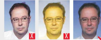
sguardo rivolto di lato tonalità innaturale della pelle